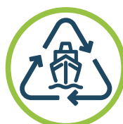
RECYCLAGE RESPONSABLE DES NAVIRES