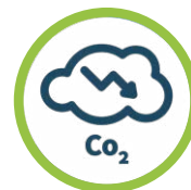
ÉMISSIONS DE GAZ À EFFET DE SERRE