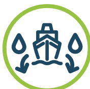
ESPÈCES AQUATIQUES ENVAHISSANTES