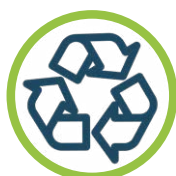
GESTION DES MATIÈRES RÉSIDUELLES